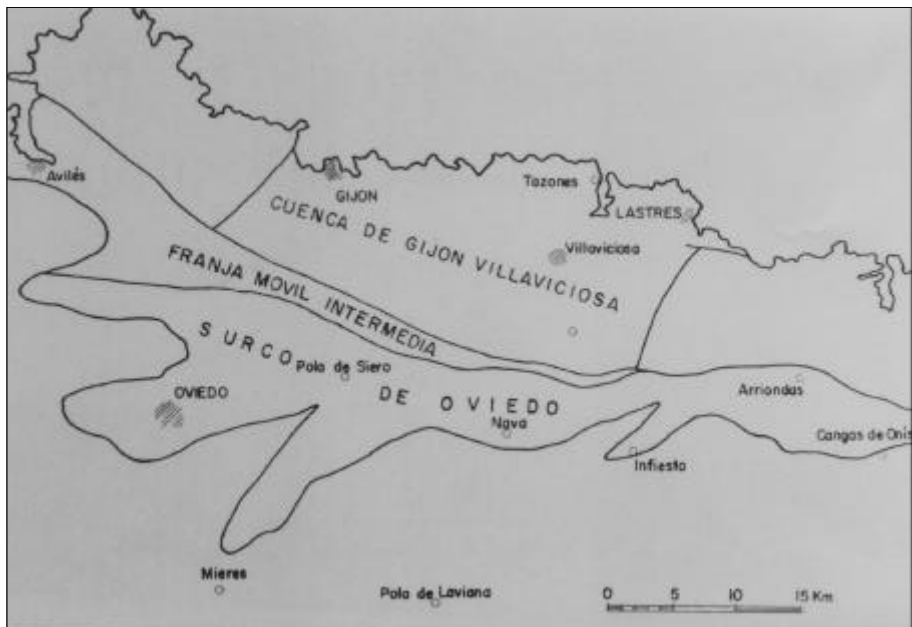
Fig. 5. Unidades de la Cuenca Mesoterciaria de Asturias (Mapa Geológico de España E. 1:50000; Hoja de Villaviciosa).

- La segunda unidad, conocida como Cuenca Mesoterciaria, está constituida principalmente por areniscas, lutitas y calizas que aparecen en posición subhorizontal, generando por tanto relieves más suaves. En esta unidad se distinguen dos subunidades limitadas por fallas finihercínicas de dirección E-O: la Franja Móvil Intermedia, que siendo la más septentrional coincidiría con la Sierra Litoral, y el Surco Oviedo - Infiesto que correspondería con los terrenos más planos del Concejo, situados entre las sierras de Peña Mayor y Litoral. Estos terrenos mesoterciarios descansan discordantes sobre un basamento paleozoico, continuación del aflorante en la Sierra de Peña Mayor.